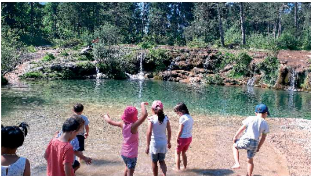
I bambini della scuola dell'infanzia a Lagole