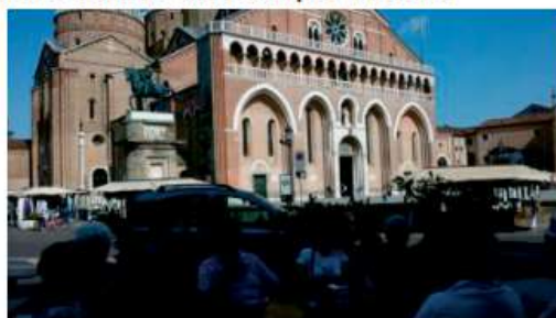
Lunedì 3 giugno: i pellegrini a S. Antonio

per avere uno spazio per passare la notte quando fanno un campo mobile!