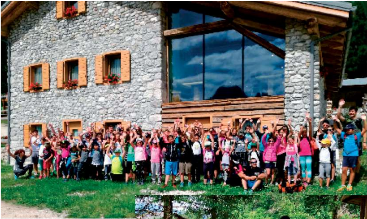
Momenti del Grest 2019