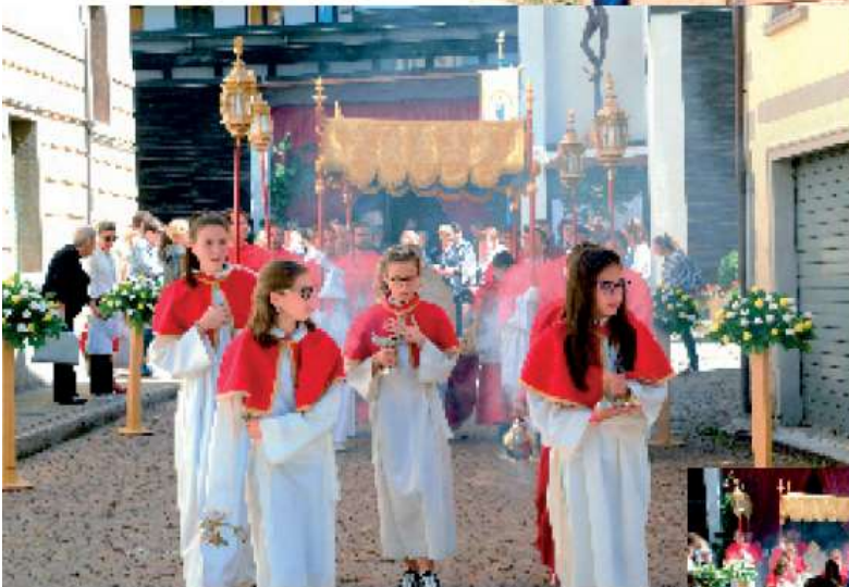
Corpus Domini 2019