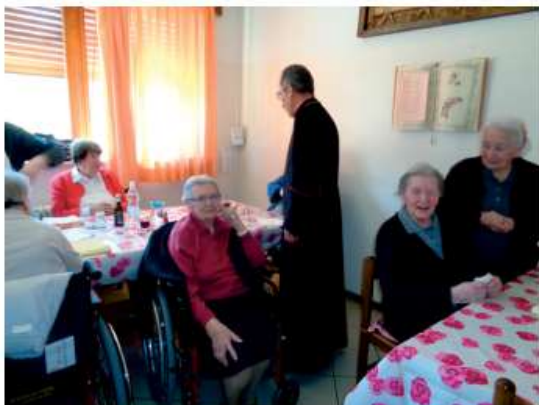
In occasione della Cresima, il Vescovo Renato prima del pranzo ha salutato le Suore e le Ospiti della nostra Casa di riposo

diocesano della Madonna della Corona a Spiazzi (VR), metà in roccia e metà in muratura sul fianco del Monte Baldo sopra la Valle dell'Adige. Anche a questo hanno partecipato alcune nostre paesane.